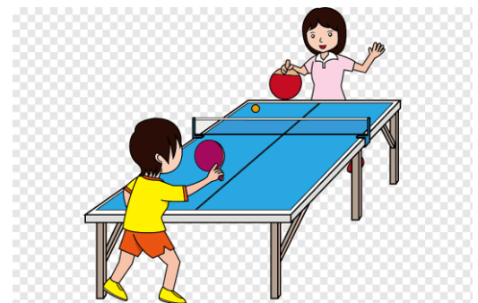
Tenis de mesa