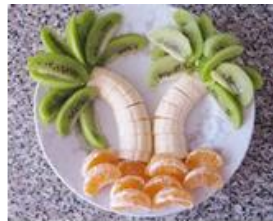
Taller de cocina